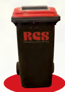
240 Ltr. Kunststoffbehälter (abschließbar)

Selbstverständlich sind unsere Mitarbeiter/-innen auf das Datengeheimnis verpflichtet.