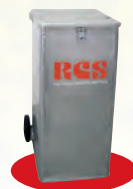
240 Ltr. Alubehälter (abschließbar)

Alt-Akten mit Ordner 0,90 Euro* pro kg Alt-Akten ohne Ordner 0,40 Euro* pro kg * Alle Preise zuzüglich geltender Mehrwertsteuer